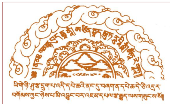
此咒置经书中可灭误跨之罪